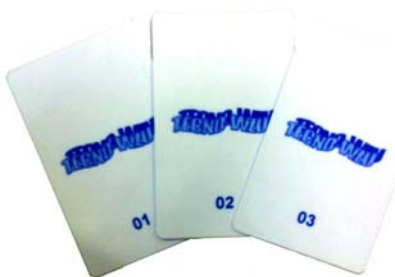
TECNO-WZU USER CARD