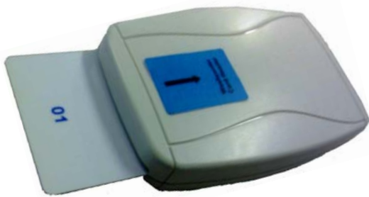
TECNO-WZU CARD READER

Das neue einfache TECNO-WZU-System für die Waschküche mit berührungslosen Karten Le nouveau simple système TECNO-WZU pour buanderies avec cartes sans contact Il nuovo semplice sistema TECNO-WZU per lavanderia con carte senza contatto